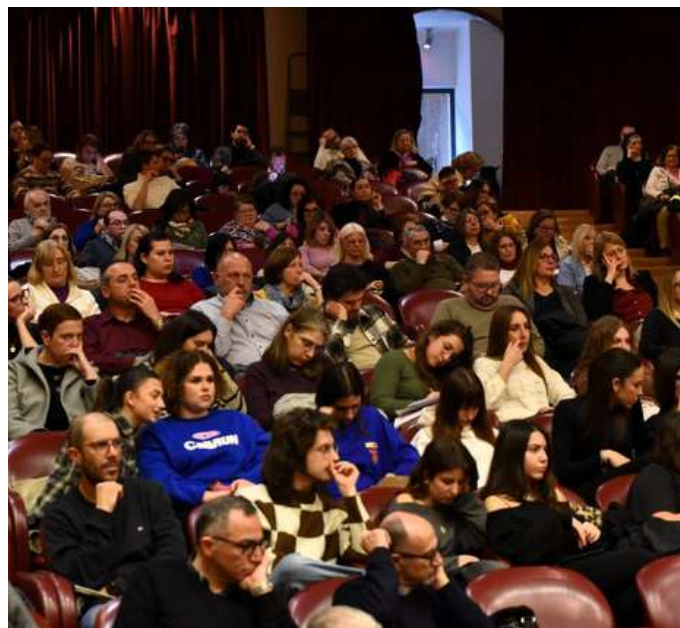
Due immagini scattate nell'Aula Magna del Rettorato

della mia vocazione al sacerdozio e poi all'episcopato, da lei riconosciuta e accompagnata, sento la gratitudine riempirmi il cuore e avverto l'impulso ad amarla e a renderla sempre più credibile e vicina a tutti!