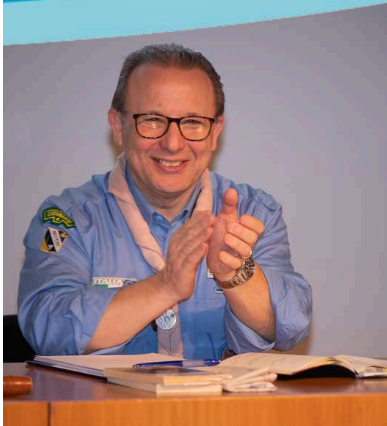
Fabrizio Marano, Capo Scout d'Italia AGESCI