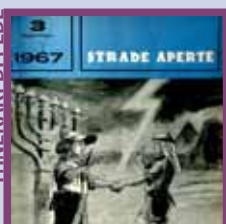
Vi do la mia pace!