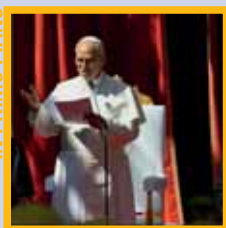
La Pace come scelta contro l'idolatria del potere