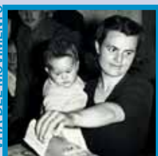
Tra Patto Comunitario e sguardi