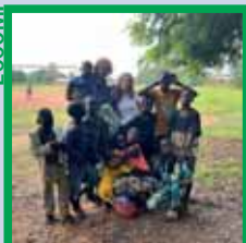
Per loro, con loro Vent'anni di Eccomi