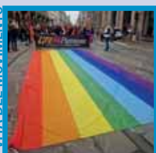
Il Consiglio Nazionale in marcia