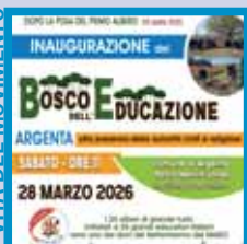
Il bosco dell'educazione