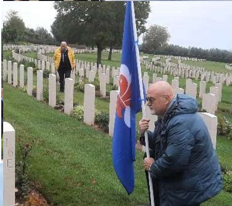
In questa pagina, foto scattate il 18 ottobre alla Carovana della Pace