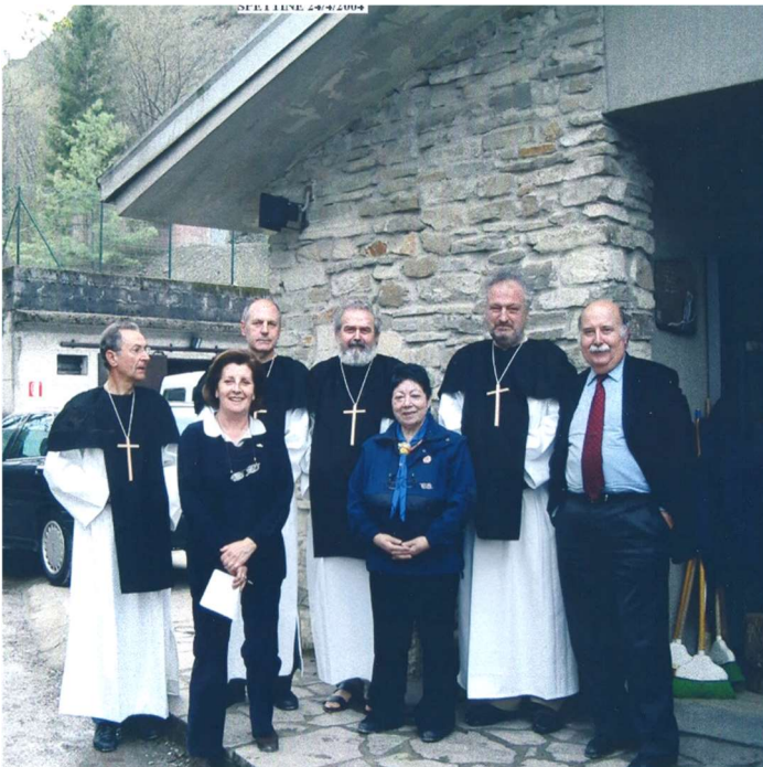
TRANSITUM PADI - 2004 - Base di Spettine

Ma c'è qualcosa di lui che penso essenziale consegnare in questo momento a chi non lo ha potuto conoscere personalmente e a fondo, qualcosa che ha caratterizzato tutto il suo percorso umano, professionale e scout.